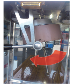
仕上がるとレバーを回して中身を出したら戻します。