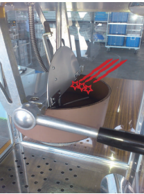
油とコーンを入れます。