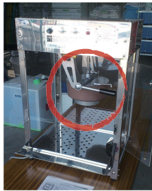
釜を設置、電源コードを刺します。